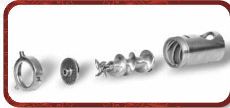
Removable Head Unit