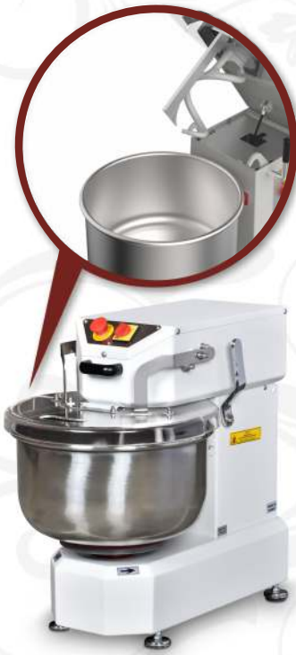
BSH.20 Kalkar Kafa