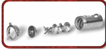
Removable Head Unit